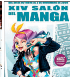
▶▶ De izquierda a derecha, portada del manga Gundam: The Origin , de Yoshikazu Yasuhiko; el grupo JAM Project, y el cartel de la feria.